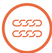
Rantai Pasok Yang Etis dan Berkelanjutan